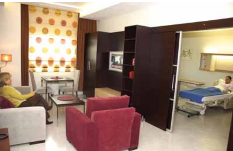
Centro Medico Teknon Spain

Ahorrar dinero no sólo significa una atención de calidad inferior. Muchos de los médicos que pertenecen a los hospitales de nuestra red han recibido capacitación en los Estados Unidos y han obtenido una certificación de la Junta de EE.UU. Los centros de nuestra red han obtenido acreditación de la Comisión Conjunta Internacional (Joint Commission International, JCI). La JCI es la sucursal internacional de la misma comisión que acredita a los hospitales en los Estados Unidos. Este estricto proceso de evaluación exige que cada centro se destaque en los indicadores estadísticos detallados que demuestran resultados superiores y satisfacción de los pacientes, junto con la aprobación de rigurosas evaluaciones in situ. La Asociación Médica Estadounidense (American Medical Association) aconseja que las empresas que recomiendan atención médica en el extranjero sólo trabajen con centros que cuenten con acreditación de la JCI.